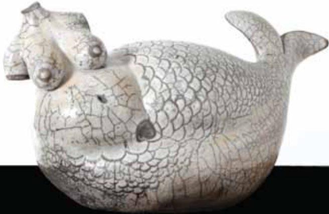
Beste Ural Hepimiz Güzemiz We Are All Beautiful , 2011

The exhibition is comprised of selected works by young artists and designers enrolled in a wide range of departments at the Anadolu University Faculty of Fine Arts. While offering the opportunity to experience the art education of the respective departments, the exhibition also strives to establish itself as a groundwork for problems of contemporary art and design, through a plethora of self-expression possibilities such as painting, printmaking, sculpture, ceramics, installation, interior design, graphic design, photography, digital art, glass, video and animation. It enables to witness the aesthetic relationship that young artists and designers –who independently choose their worlds, problematic, materials, methods, and language– establish with the present time across a wide range.